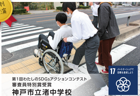
第1回わたしのSDGsアクションコンテスト 審査員特別賞受賞 神戸市立渚中学校