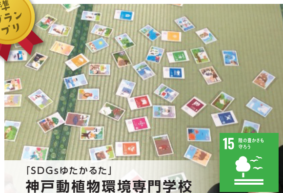
「SDGsゆたかるた」 神戸動植物環境専門学校