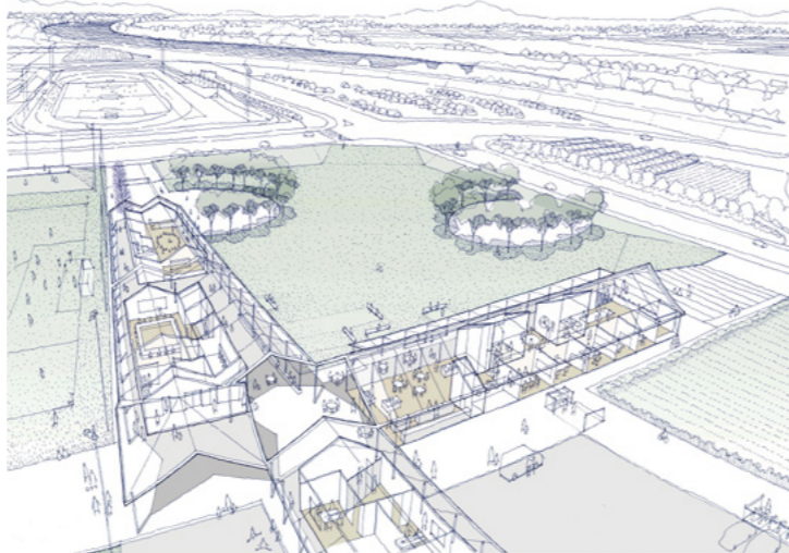
完成イメージ図(外観)