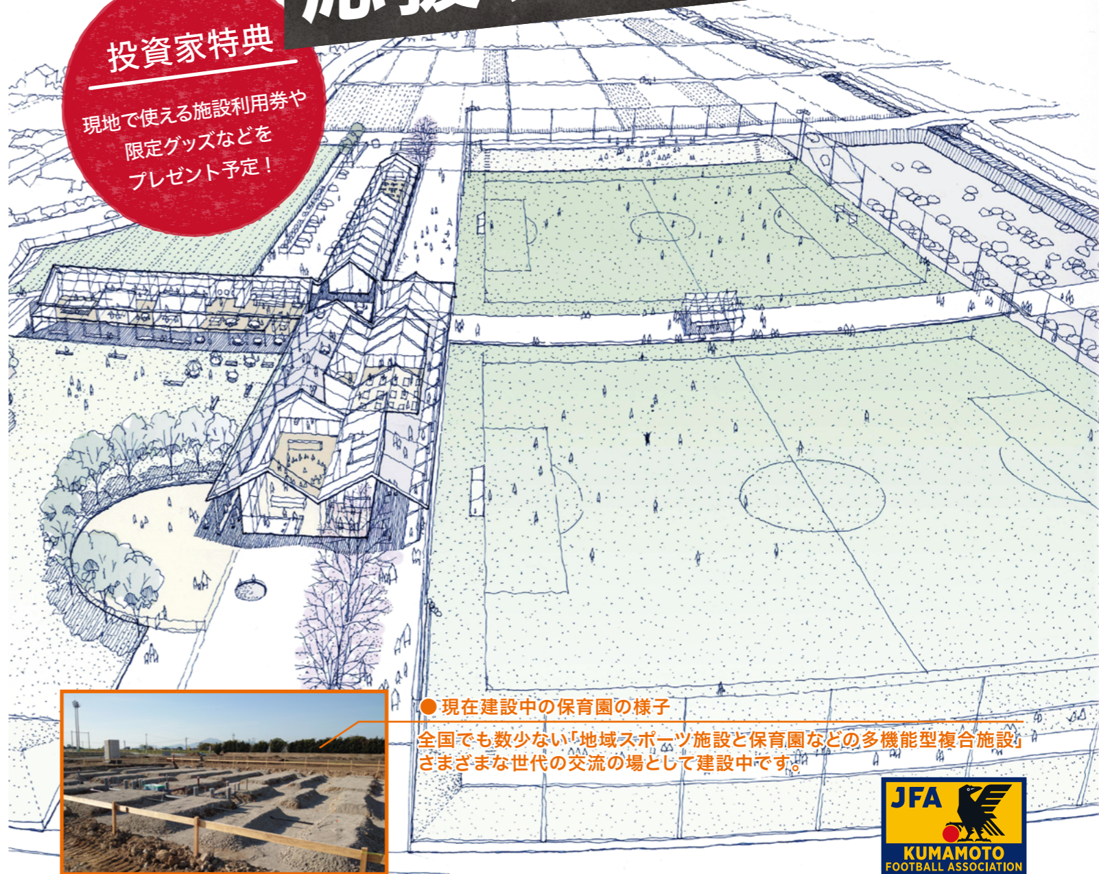
●現在建設中の保育園の様子

全国でも数少ない「地域スポーツ施設と保育園などの多機能型複合施設」 さまざまな世代の交流の場として建設中です。