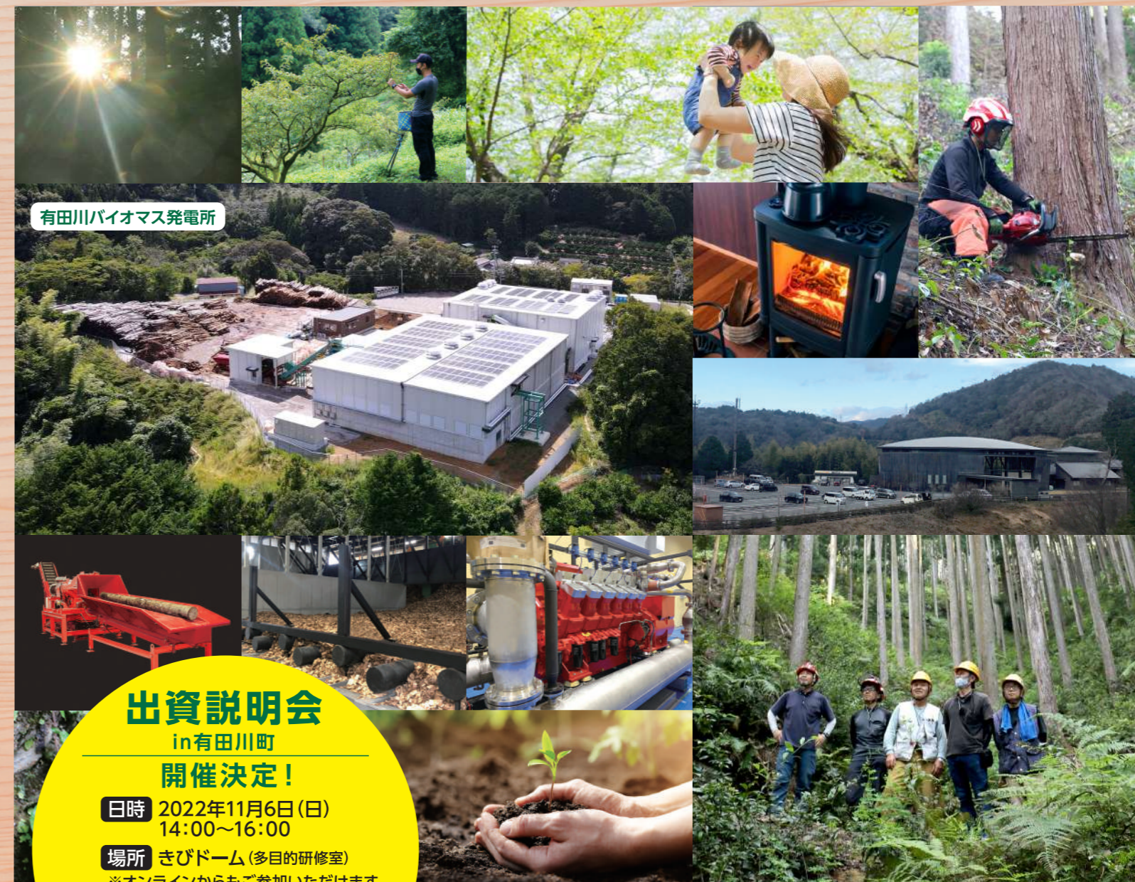
有田川バイオマス発電所