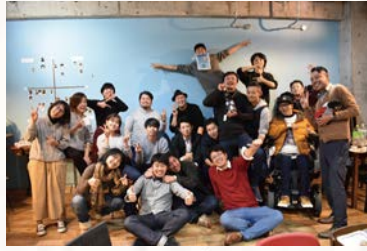
西条市の地域おこし協力隊として赴任・移住し 行った「ローカルベンチャー誘致・育成事業」