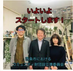
四国初となるコミュニティ財団 「公益財団法人えひめ西条つながり基金」を発足