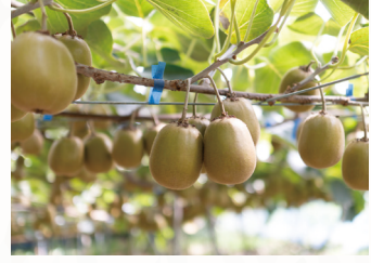
収穫される農産物