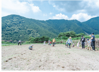
丹原地域の耕作放棄地でのひまわり栽培体験イベントの様子