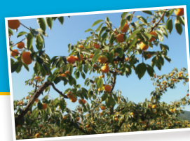
魅力スポットを巡り 人と笑顔が循環するまちへ!